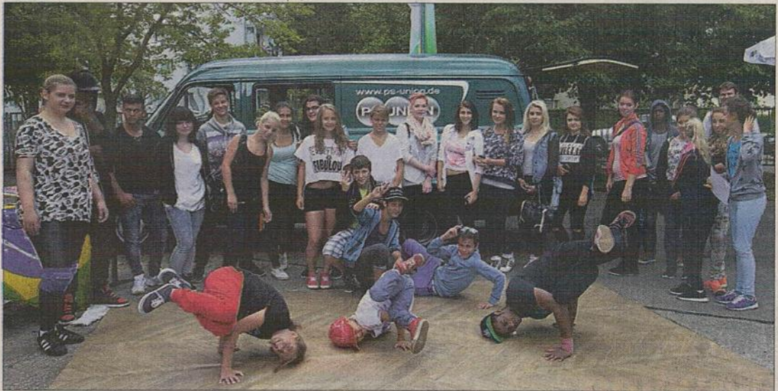
Das „BiBo“-Festival war in dieser Woche auf Werbetour in Halles Südstadt unterwegs – nicht ganz zufällig in der Fliederweg-Sekundarschule, wo es auch Migranten-Klassen gibt.